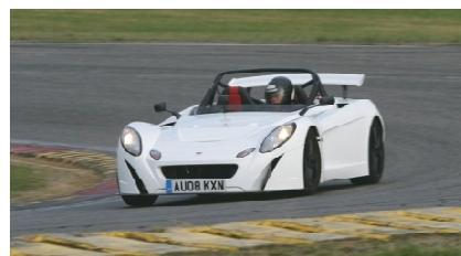
1 - Lotus Tow Eleven 250 cv