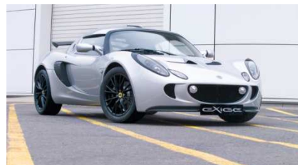
2 - Lotus Exige Cup 260 cv