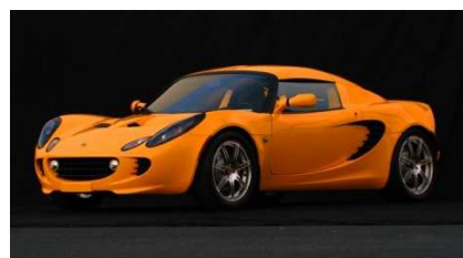
1 - Lotus Elise R 192 cv

08h30 Accueil petit déjeuner et prise du véhicule 08h30 - 09h00 Briefing 09h00 - 12h00 Roulage libre avec pilote instructeur (nombre de tours illimité) 12h00 - 14h00 Déjeuner 14h00 - 17h30 Roulage libre avec pilote instructeur (nombre de tours illimité) 17h30 Pot de départ