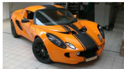
1 - Lotus Elise SC 250 cv

09h30 - 10h00 Accueil sur circuit (café, viennoiseries...) 10h00 - 10h30 Briefing 10h30 - 12h00 série de 10 tours en Fun Cup (1 série /pers) 12h00 - 14h00 Repas 14h00 - 16h30 Série de 10 tours en Lotus (2 séries /pers) 16h30 - 17h30 Baptême de 2 tours en Lotus 2/11 JS49 (avec pilote instructeur) 17h30 Pot de départ et remise des diplômes et cadeaux souvenir